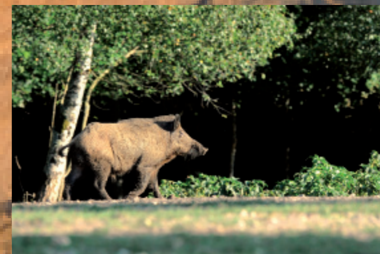
De très beaux mâles sangliers sont présents sur le territoire du Domaine du Bois Chevalier.