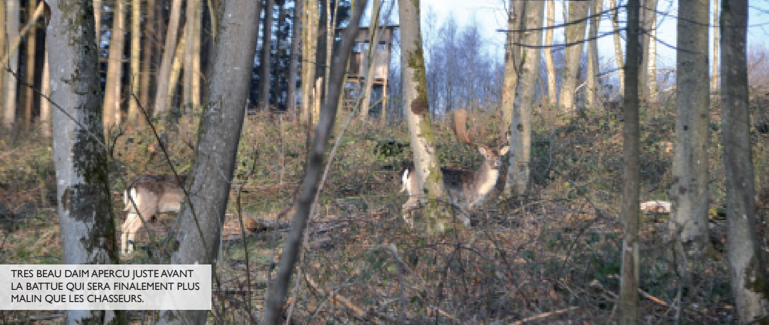
TRES BEAU DAIM APERCU JUSTE AVANT LA BATTUE QUI SERA FINALEMENT PLUS MALIN QUE LES CHASSEURS.