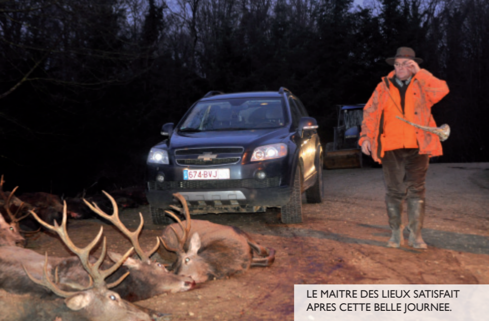
LE MAITRE DES LIEUX SATISFAIT APRES CETTE BELLE JOURNEE.

Ne vous y trompez pas, les Ardennes ne sont pas si loin, seulement 2h15 de Paris en voiture.