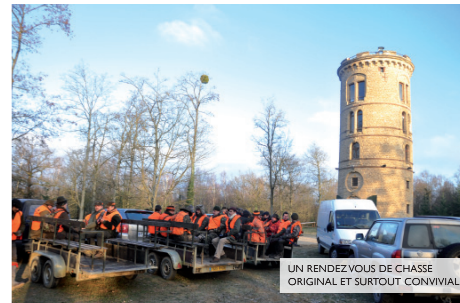
UN RENDEZ VOUS DE CHASSE ORIGINAL ET SURTOUT CONVIVIAL.

Tout le monde est en place, et plusieurs questions se posent à nous : nos amis habitués des lieux auront-ils raison ? Les animaux seront-ils au rendez-vous dans la traque ?