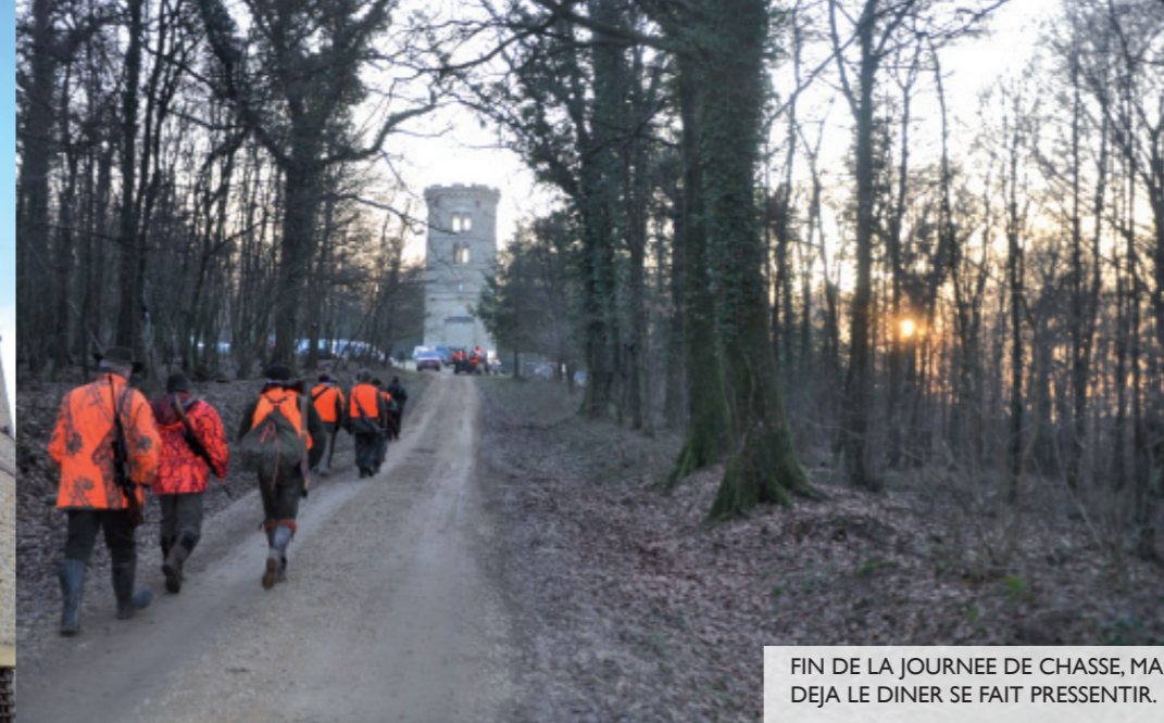
FIN DE LA JOURNEE DE CHASSE, MAIS DEJA LE DINER SE FAIT PRESENTIR.

Le territoire de chasse est propre à la région et l'on oublie facilement que le domaine est clos. Le gibier rencontré est varié et tous les efforts sont développés pour avoir des animaux combattifs qui passent la ligne rapidement. Rappelons tout de même que nous ne sommes pas en forêt ouverte, vous ne rencontrerez par conséquent pas un gibier ayant les mêmes aptitudes de survie qu'un animal dans la nature. Mais peu importe et il faut le souligner, tous les chasseurs présents ce jour se sont pris au jeu et repartent des Ardennes la tête emplie de souvenirs. ■