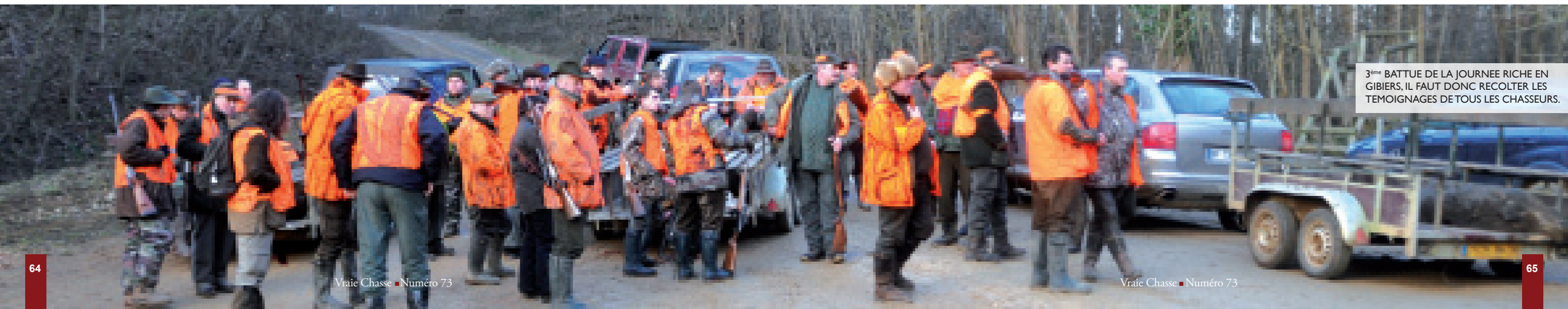
3 ème BATTUE DE LA JOURNEE RICHE EN GIBIERS, IL FAUT DONC RECOLTER LES TEMOIGNAGES DE TOUS LES CHASSEURS.

En fin de journée, les animaux sont dignement présentés et les honneurs sont remis à chacun avec une vraie connaissance des traditions cynégétiques locales.